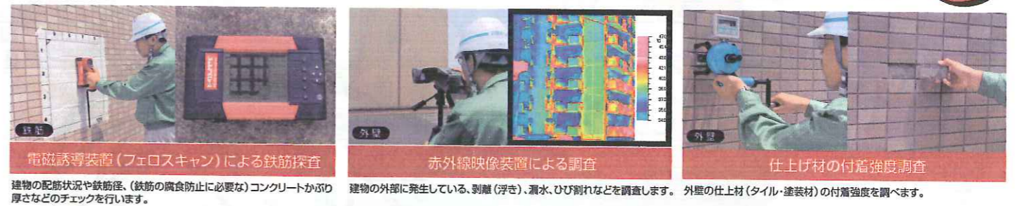
建物の配筋状況や鉄筋径、(鉄筋の腐食防止に必要な)コンクリートかぶり厚さなどのチェックを行います。 建物の外部に発生している、剥離(浮き)、漏水、ひび割れなどを調査します。外壁の仕上材(タイル・塗装材)の付着強度を調べます。